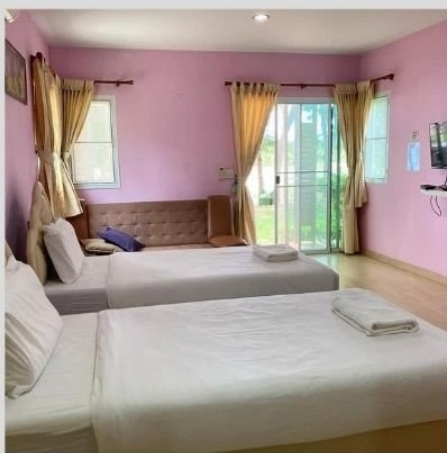
ห้องเตียงคู่ Twin bed room