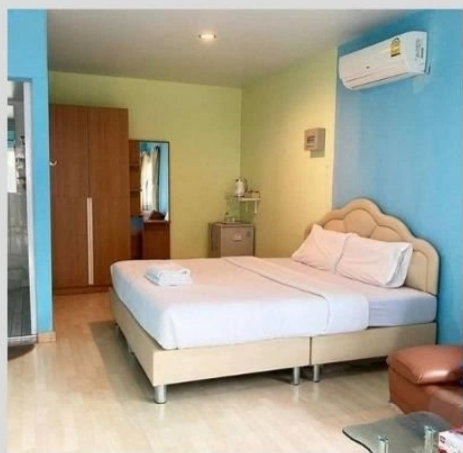
ห้องเตียงเดี่ยว Double bed room

Remark: Hairdryer is not available at the resort, kindly bring your own.